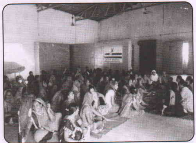
कोहेजन ट्रस्ट गाँव : आंबलियासन