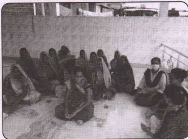
सेवा बोडेली गाँव : पानेज

वर्ष 2020-2021 के दौरान हम स्वैच्छिक संस्था के साथ ऑनलाइन बैठक कर रहे थे। इसलिए, इस वर्ष के दौरान, जो पहले वीमोसेवा के माध्यम से हमारे साथ जुड़े हुए हैं, वे गुजरात या गुजरात के बाहर की संस्था की मुलाकात करके योजना के बारे में चर्चा की और किस तरह से आगे बेहतर काम कर सकते हैं। विमोसेवा की विभिन्न योजनाओं के बारे में सूचित करने के लिए नए संस्था की खोज करना और उनकी मुलाकात करना।